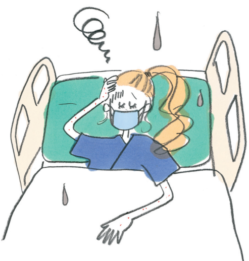
国によっては、伝染病が流行している場合も。簡易登録しておけば、旅の前からお知らせを受け取れる。