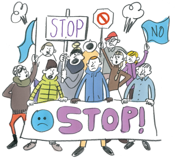
デモが予定されている場合は事前に、日程や場所をお知らせ。クーデターによる外出禁止令が出されたことも。

「三度の飯より旅が好き」と言う、アンアン総研の3人。旅先選びや旅先で困ったときの対処法などについて話してくれた。旅先が安全か、今現在の情報が知りたい!